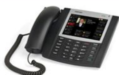
Aastra 6700i Series