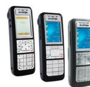
Aastra 600d Series

Pour tout renseignement ou démonstration contactez nous !